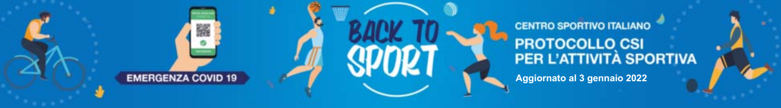
TABELLA ATTIVITÀ CONSENTITE SENZA/CON GREEN PASS “BASE”/“RAFFORZATO”

Cfr. file completo su www.governo.it/sites/governo.it/files/documenti/documenti/Notizie-allegati/tabella_attivita_consentite.pdf