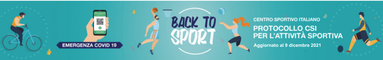
TABELLA ATTIVITÀ CONSENTITE SENZA/CON GREEN PASS “BASE”/“RAFFORZATO”

Cfr. file completo su https://www.governo.it/sites/governo.it/files/tabella_attivita_consentite.pdf